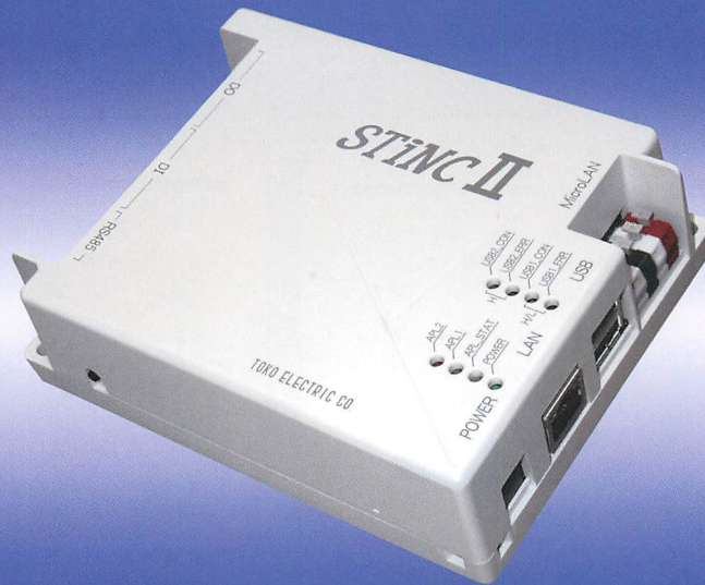
インテリジェント・ネットワーク・コントローラ(STiNCII)