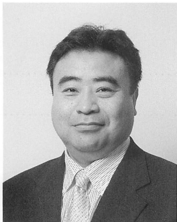
東京大学大学院 情報理工学系研究科 教授 江崎 浩

19 世紀の終盤に産声をあげた電気事業は、20 世紀の社会・産業成長を支える基盤インフラとして、その責任を果たしてきた。電力エネルギーは、再生可能エネルギーの本格的導入など、エネルギー源の多様化をしながら、21 世紀も、引き続き重要な社会・産業の基盤インフラとして、人類社会の成長と発展を支えなければならないと考えられる。